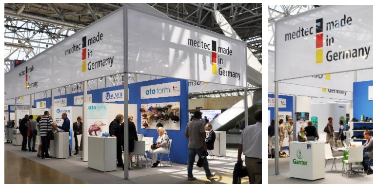
Standbaukonzept: deutscher Stand für Medizintechnik